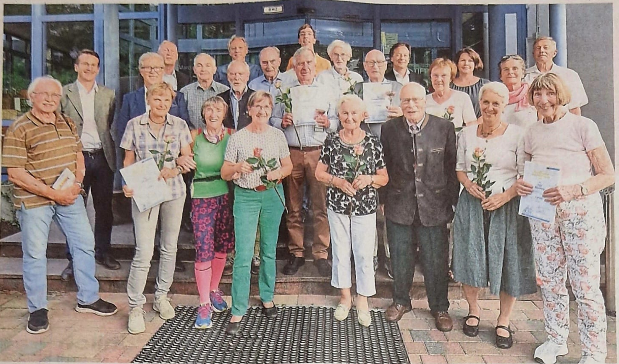
Immer aktiv geblieben: die ausgezeichneten „Wiederholer“ des Sportabzeichens bei der Preisverleihung in Herrsching.

Die Ehrung der sogenannten Wiederholer, die seit Jahrzehnten das Sportabzeichen ablegen, ist Tradition bei der Veranstaltung. Und so wurden auch heuer in Herrsching viele ältere Sportler